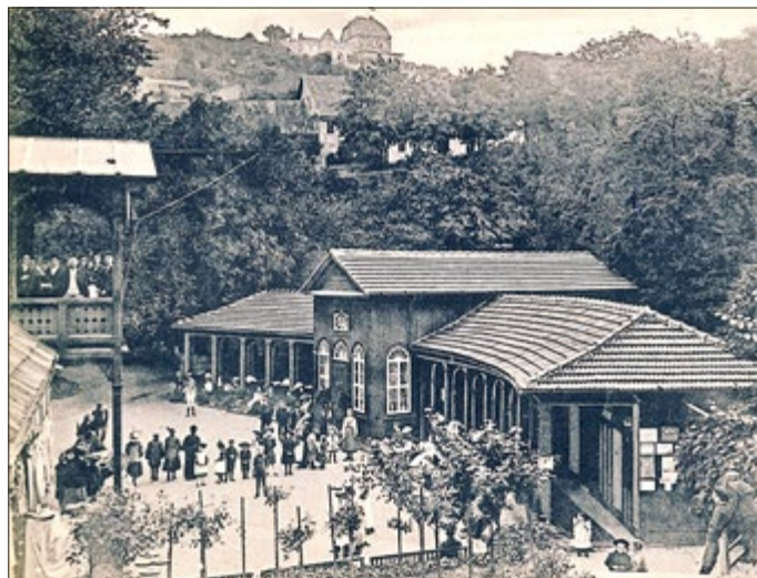
Kurbetrieb im Unteren Bad (Quellgrund) um 1905

Wegen begrenzter Teilnehmerzahl bitten wir um verbindliche Anmeldung zum Vortrag.