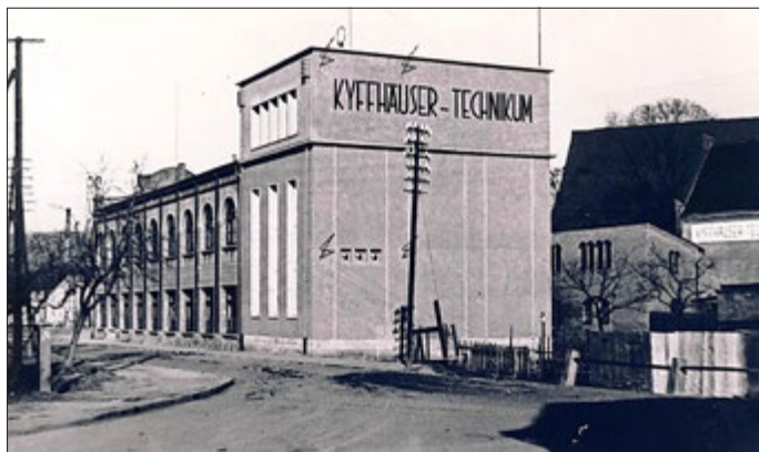
Die Laboratorien des Kyffhäuser - Technikum 1932

Ebenso bitte zuvor telefonisch anmelden, da uns momentan nur 50 Plätze im Vortragsraum zur Verfügung stehen.