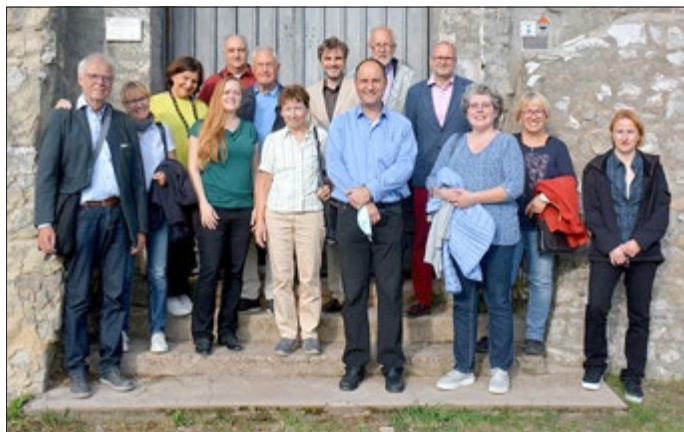
Die Mitglieder der Arbeitsgemeinschaft am Hausmannsturm.

Können die finanziellen Mittel aufgebracht werden, geben wir zur Wanderausstellung auch einen Begleitband heraus.