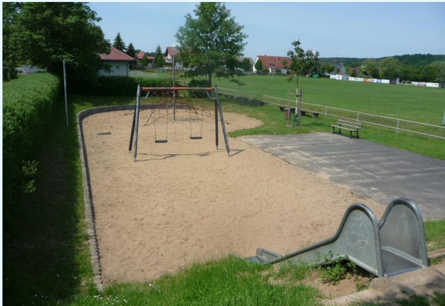
Spielplatz am Sportplatz