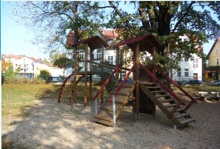
Spielplatz Machold'scher Garten