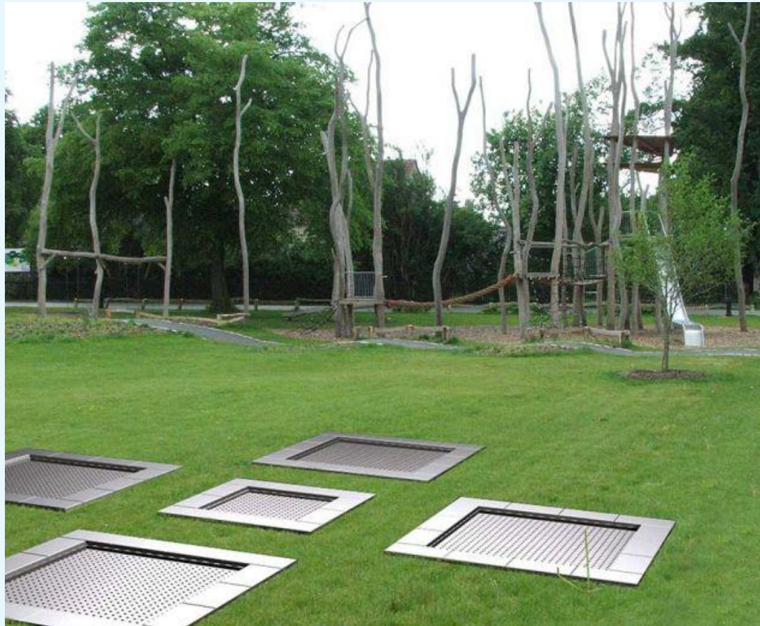
Bodentrampolin (Beispiel: Katalog)