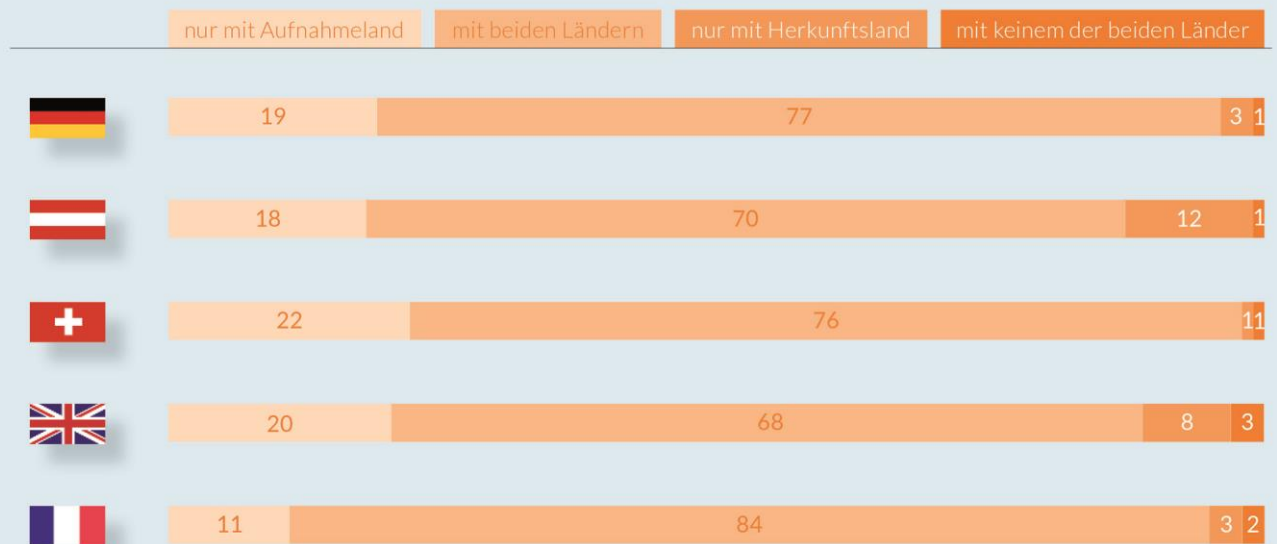
ABBILDUNG 1: Nationale Verbundenheit* der Muslime in fünf europäischen Ländern (in %)

* Fragen: „Wie verbunden fühlen Sie sich mit [jeweiliges Aufnahmeland]?“; 2. „Wie verbunden fühlen Sie sich mit [Ihrem Herkunftsland/dem Herkunftsland Ihrer (Groß-) Eltern]? Antwortkategorien: 1 „sehr verbunden“; 2 „eher verbunden“; 3 „eher nicht verbunden“; 4 „überhaupt nicht verbunden“. Abgebildet sind die zusammengefassten Prozente für diejenigen, die jeweils die Antwortoptionen 1 und 2 gewählt haben.