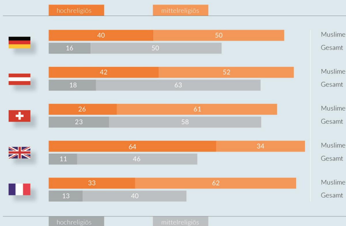
ABBILDUNG 2: Religiosität in fünf europäischen Ländern – Muslime im Vergleich zur Gesamtbevölkerung* (in %)

Ein weiteres bemerkenswertes Ergebnis ist die unterschiedliche Bedeutung von Religion für muslimische Bürger einerseits und Bürger einer anderen beziehungsweise ohne Glaubenszugehörigkeit andererseits. Ein Beispiel für besonders große Diskrepanzen ist das Vereinigte Königreich: Hier leben Muslime im Ländervergleich ihre Religion am intensivsten, während ein Großteil der Bürger eher areligiös ist; rund jeder zweite kann als nichtreligiös bezeichnet werden, nur jeder zehnte nichtmuslimische Brite ist hochreligiös (siehe Abbildung 2). Eine Frage, die sich an dieser Stelle stellt ist, welchen Einfluss diese Unterschiede auf das gesellschaftliche Zusammenleben nehmen können. Nur in der Schweiz gibt es kaum Unterschiede in der Bedeutung von Religion zwischen muslimischen und anders- beziehungsweise nichtgläubigen Gruppen.